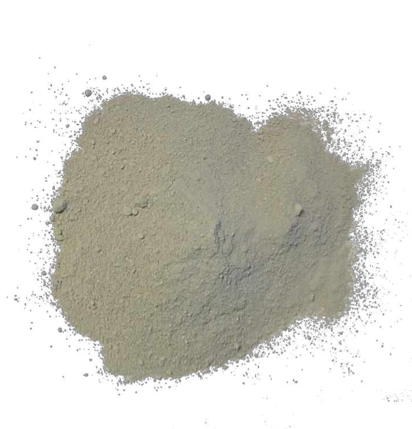
Рис. 3. Продукт измельчения