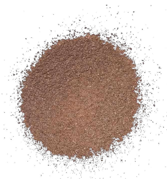
Рис. 2. Материал до измельчения